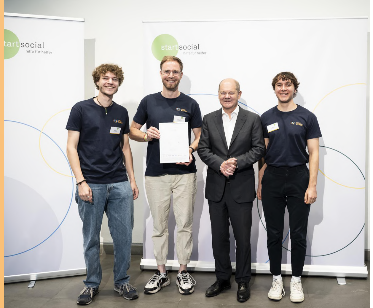
Bei der Start Social Bundespreisverleihung mit Olaf Scholz

3 Co-Founder | 10 Ehrenamtliche 2 Berater:innen 5 betreute Projektarbeiten